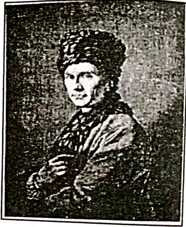
ஜீன் ஜேக்கஸ் ரூசோ.

மாண்டஸ்க்யூவின் இந்த அதிகாரப்பிரிவினைக் கோட்டுப் பிரெஞ்சு மக்களிடையே பெரும் செல்வாக்குப்பெற்றது. புரட்சிகர இக்கருத்துக்களுக்கு மக்களிடம் நல்ல வரவேற்பு இருந்தது. அவ் புதிய அரசியலை உருவாக்கத் துடித்தனர். புரட்சியாளர்களுக்கு அரசாங்கத்தை ஏற்படுத்துவதற்கு இக்கொள்கைகள் பெரிதும் உதவி என்று கூறலாம்.