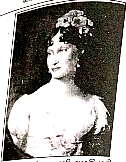
நெப்போலியனின் இரண்டாம் மனைவி அழகி மரியலூயிசு ஐரோப்பாவிலேயே யாரும் கண்டதில்லை என்ற புகழ் ஏற்பட்டது.

b) நெப்போலியன் ஒல்டன்பர்க் (Oldenburg) என்ற ஜெர்மனியின் பரந்த நிலப்பகுதியை வெற்றியின் மூலம் இணைத்துக்கொண்டதால், அவரது ஆதிக்க வெறியை ரஷ்ய மன்னர் சார் அலெக்சாந்தர் வெறுத்தார்.